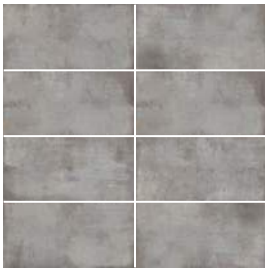
Fumée | Smoke