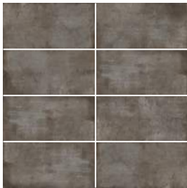
Tabac | Tobacco