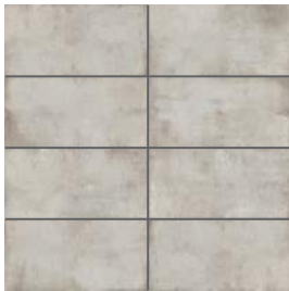
Gris pâle | Light Grey