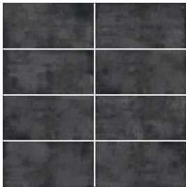
Noir doux | Soft Black

Le format illustré ci-dessus est 12" x 24". Certaines faces ne sont pas illustrées. Veuillez consulter le devant de cette fiche pour voir tous les formats offerts. / The format shown above is 12" x 24". Not all the faces are shown. Please refer to the front page of this data sheet for all available formats.