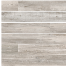
Vison | Mink