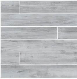
Gris | Grey