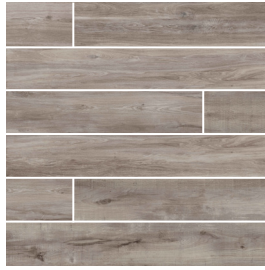
Grège | Greige