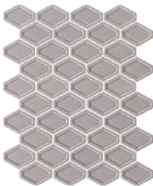
Gris | Grey