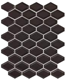
Noir | Black

Le format illustré ci-dessus est 2" x 2". / The format shown above is 2" x 2".