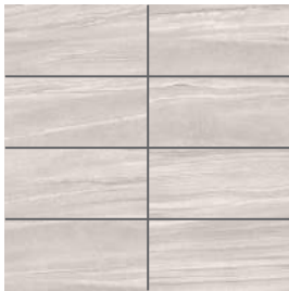
Gris pâle | Light Grey