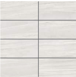
Blanc | White